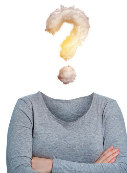
À venir Direction générale

Centre intégré universitaire de santé et de services sociaux de la Mauricie-et- du-Centre-du-Québec