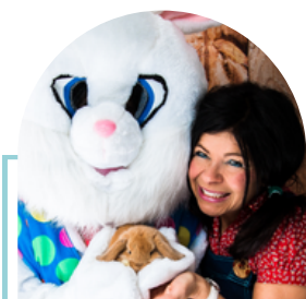
Mandolyne Animation d'activités d'heure du conte